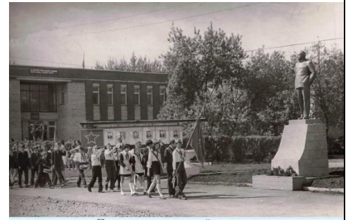
Пионеры на центральной площади, поселок Буланаш 1970-е годы.

Название «пионерский горн» появилось практически в одно время с термином «пионер». Звук горна был призывом пионеров к единению, служению добру, поиску и установлению справедливости и той деятельности, которая направлена на защиту Родины. Сигналы, которые издавал