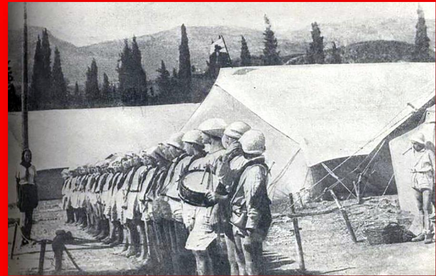
Пионерская линейка в «Артеке». 1925 г.