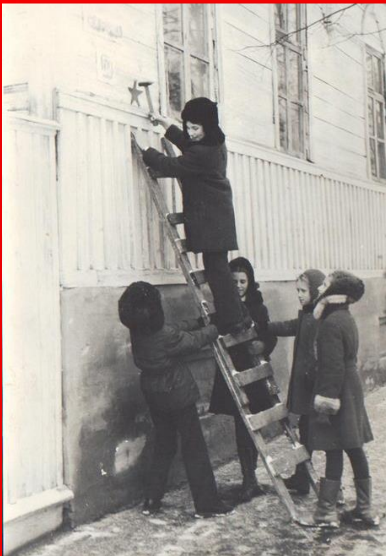
Члены штаба «Тимуровец» при музее А.П. Гайдара прибывают на дом красную звезду