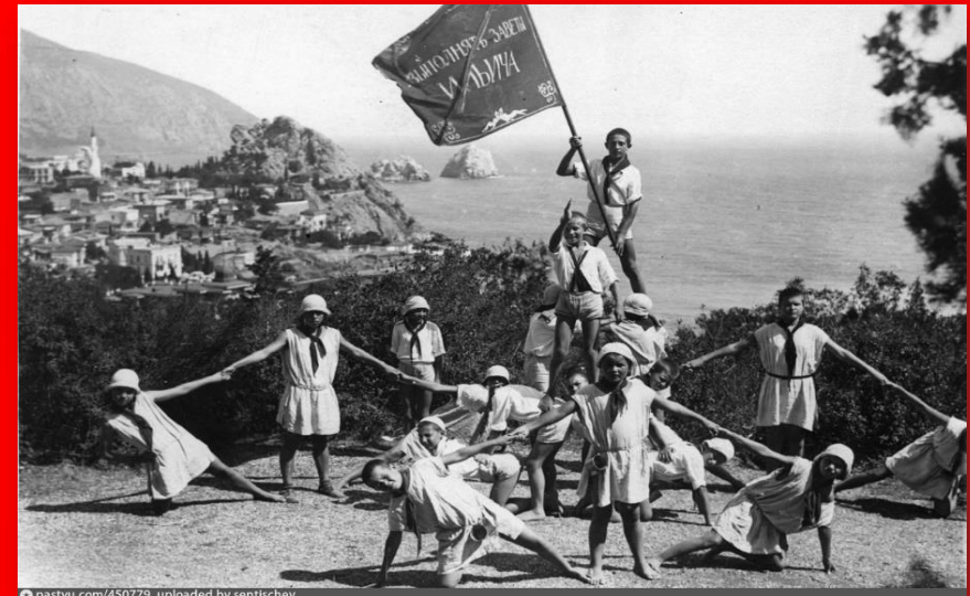
Пионеры из пионерского лагеря «Артек». 1926 г.