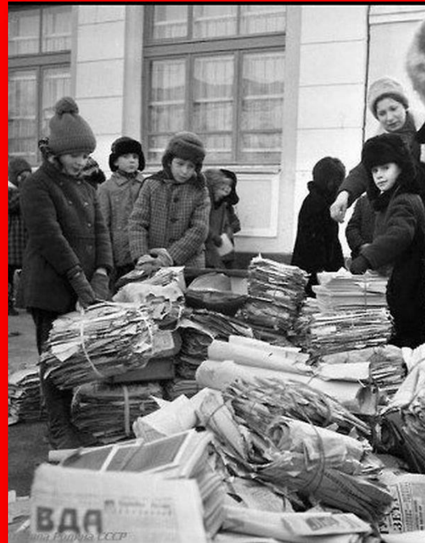
Сбор макулатуры пионерами