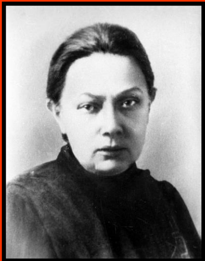
Надежда Константиновна Крупская

Идея создания пионерской организации была сформулирована Н.К. Крупской . В 20-х числах ноября 1921 года она несколько раз в разных местах выступила с докладом «О бойскаутизме» (доклад был вскоре опубликован брошюрой под заглавием «РКСМ и бойскаутизм»), в котором предложила комсомолу взять на вооружение скаутские методы и создать детскую организацию, «скаутскую по форме и коммунистическую по содержанию».